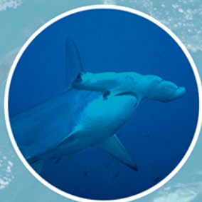
Especies endémicas o en riesgo