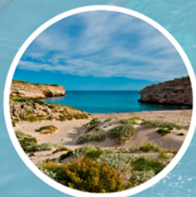
Playas y dunas