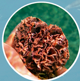
Ecosistemas de rodolitos