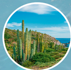
Zona árida insular