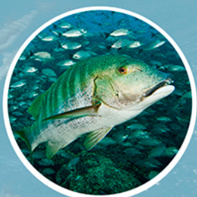
Peces e invertebrados de valor comercial