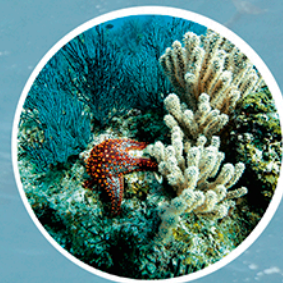
Ecosistemas de arrecifes